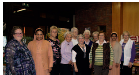
Der Handarbeitskreis Neubeckum auf seinem Basar am 30. Oktober