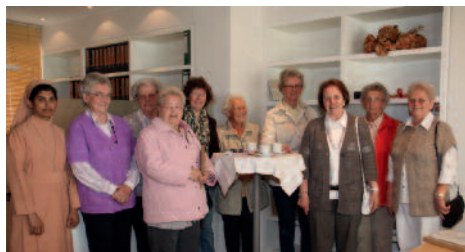
Der Handarbeitskreis Oelde zu Besuch im Hilfswerks-Büro am 17. September