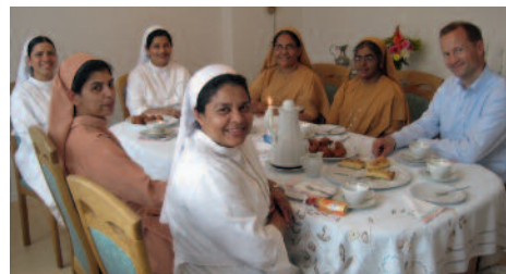
Kurzaufenthalt im Konvent der indischen Schwestern in Fulda