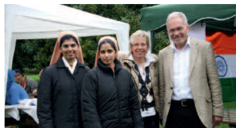
Präsenz des Ordens und des Hilfswerks auf dem Pfarrgemeindefest in Rhöndorf