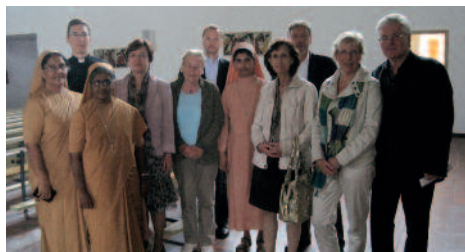
Besuch in der Gemeinde St. Maria Wetzgau-Rehnhof bei Schwäbisch-Gmünd

Ihnen einen kleinen Eindruck von den vielfältigen Aktivitäten der letzten Monate geben.